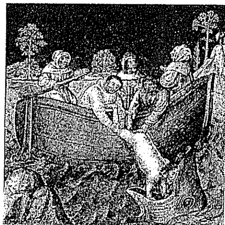
図1 「海に放りこまれたヨナ」。15世紀のフランドルの文書「人の救いの鐘」から。シャンティリ美術館。

“1891年2月のこと、フォークランド島の近くで、捕鯨船スターオブザイースト号が1頭の大きなマッコウ